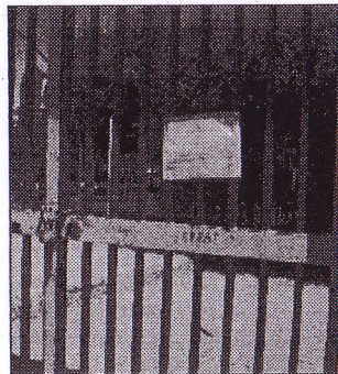
Il cancello sbarrato

sfere di plexiglas che proteggono le lampade". Disapprovato il gesto malsano non solo dagli adulti ma anche da tanti ragazzini che, per centralità urbana e perché unico spazio sicuro, sino ad oggi, arredato a parco giochi, trascorrono buona parte del loro tempo libero. "E' l'ennesimo episodio ha scritto il sindaco Leonardo Giordano in una nota - dopo quelli avvenuti alla Scuola